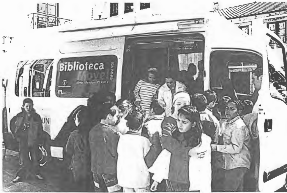
A inauguração da Biblioteca Móvel marcou a Semana da Educação.

A Biblioteca Móvel transporta cerca de mil volumes com temáticas diferentes e computadores com acesso à Internet.