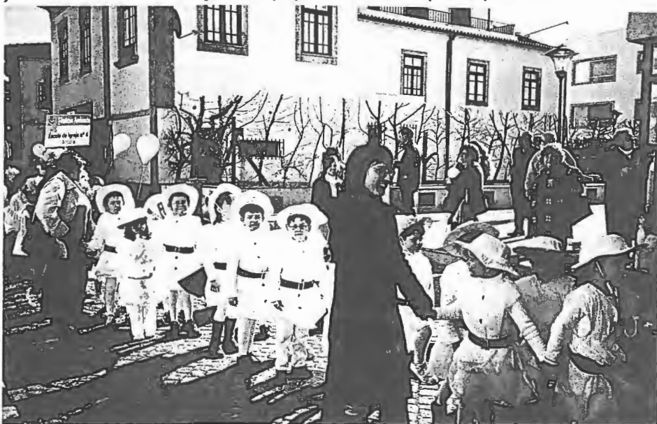
Os "Sargaceiros de Mar", do Centro Social de Mar, colaboraram no Carnaval em Esposende

No final foi servido um lanche a todos os participantes.