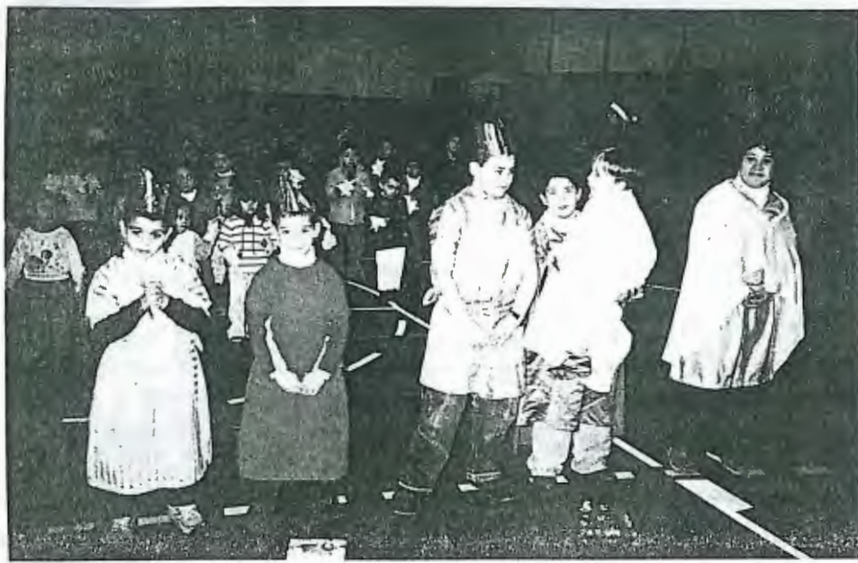
A Festa de Natal teve a participação activa das crianças que frequentam o Centro Social de Mar