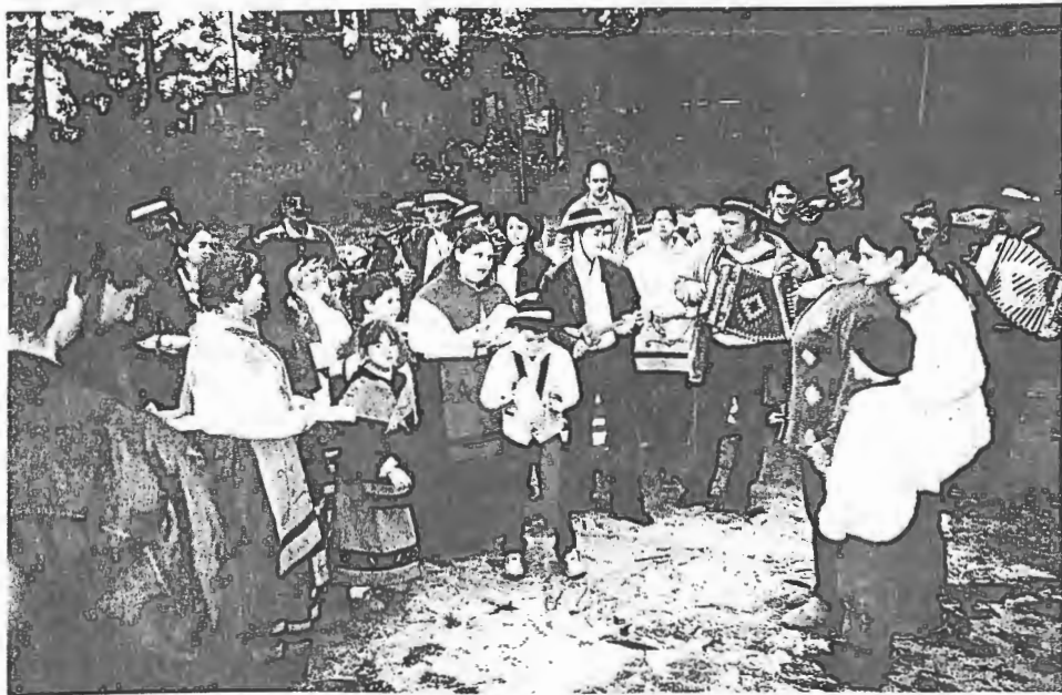
O Grupo das Janeiras cantou e encantou a freguesia.

No dia 18 de Janeiro, o adro da Igreja Paroquial encheu-se de tractores de lenha. Foram só trinta e nove os vendidos pela Comissão de Festas de S. Bartolomeu. Esta iniciativa mereceu a pena, sobretudo porque a colaboração das pessoas foi notória, o que deixou a Comissão uma vez mais satisfeita.