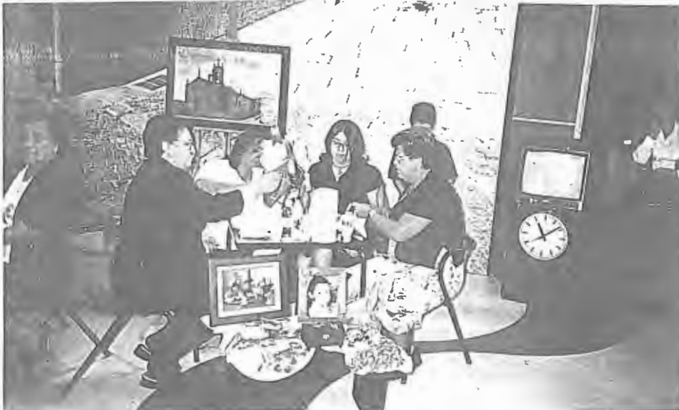
As artes decorativas que ocupam as noites de muitas artistas não faltaram na Praça da Alegria do dia 21 de Agosto de 2003