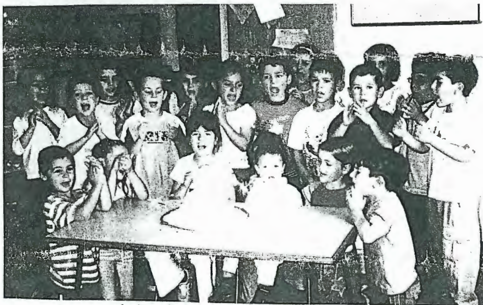
Os finalistas deixam, com saudade, o Centro Social de Mar

final das actividades do Centro, que se realizou no dia 26 de Junho.