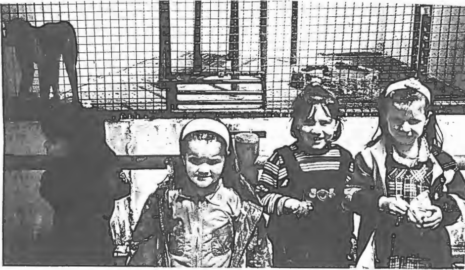
Estas nossas caras larocas e fofinhas testemunham a alegria de visitar o Zoo da Maia.