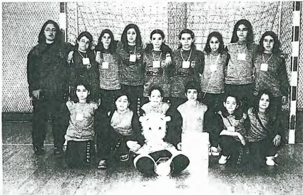
As INFANTIS trouxeram mais um título para a Juventude de Mar

2002 - Andebol Feminino - Centro Social de Mar Campeão Nacional em Inicidas e Juvenis