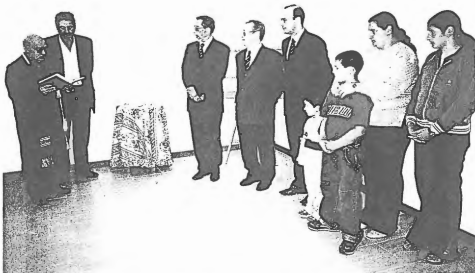
Esposende Solidário, Câmara e Junta de Freguesia trazem felicidade à família Anjos Parente

Referindo-se às necessidades locais referiu que a freguesia ainda apresenta algumas necessidades neste sector mas