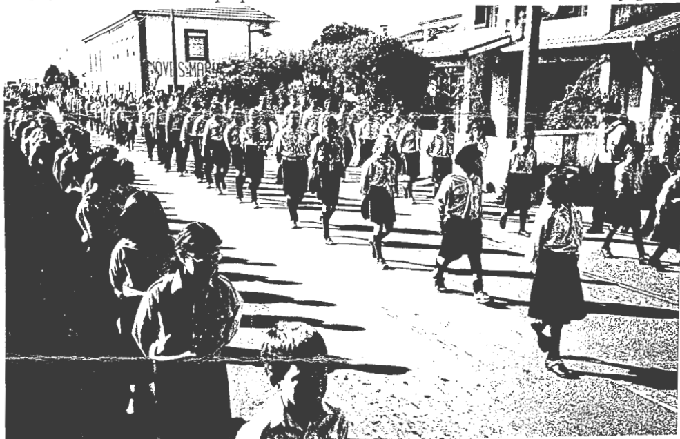
Os Escuteiros entraram em todas as famílias