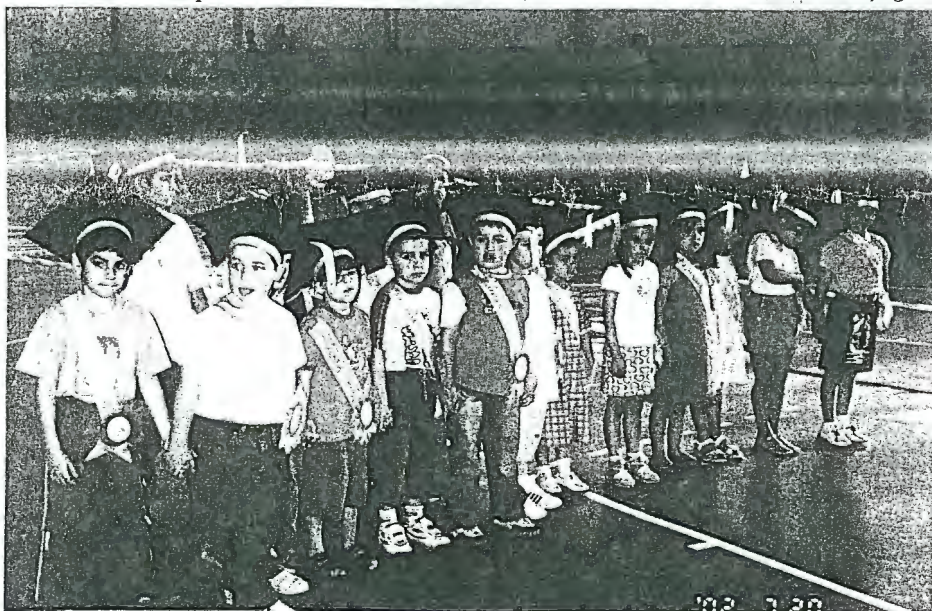
Os finalistas de 2001/2 posam para a posteridade