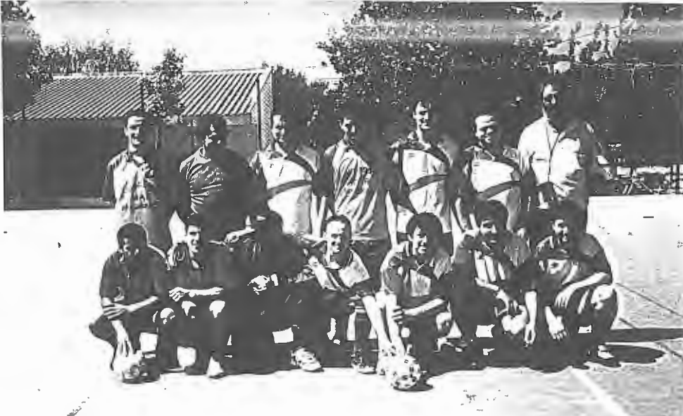
A equipa da Juventude de Mar que participou no jogo em Cem Soldos

Ficou acordado que, nos mês de Setembro, receberemos a visita do Sport Club Operário de Cem Soldos.