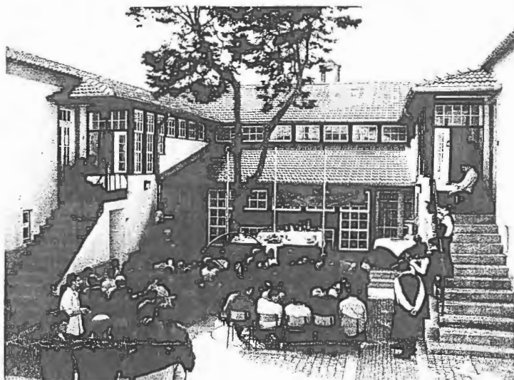
Aspecto do Concurso de Cocktail