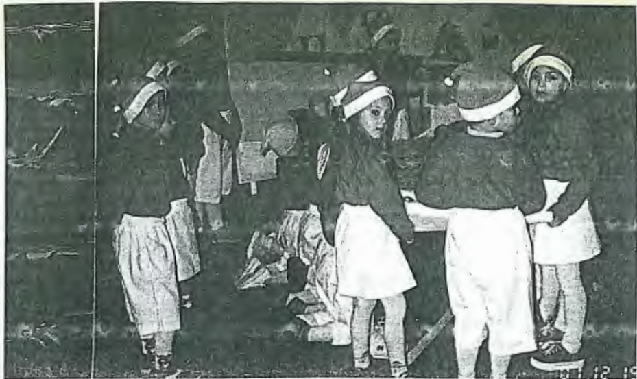
As crianças do Centro Social encantaram na Festa de Natal

A tradicional Festa de Natal para as crianças do Centro Social de Mar decorreu no dia 16 de Dezembro. Com o Pavilhão Gimno-desportivo praticamente cheio, as crianças tiveram um dia inesquecível, com um grande calor humano a rodeá-las e com um programa cheio de atractivos que entusiasmou não só as crianças, mas também os familiares presentes.