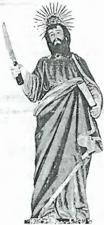
S. BARTOLOMEU Padroeiro da Freguesia de Mar