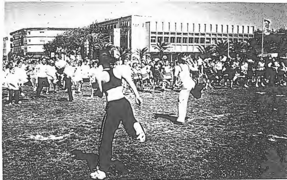
Centena e meia de Bambis animaram o SuperFestand de Esposende

Integrado no circuito oficial da Associação de Andebol do Porto, coube ao Centro Social da Juventude de Mar organizar este evento que habitualmente encerra a época desportiva para o escalão de Bambis (7 aos 10 anos).