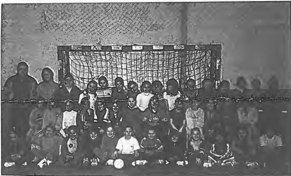
As Bambis do Centro Social prometem a continuidade do Andebol no concelho

Os rapazes têm o seu dia de glória às segundas-feiras, integrados num projecto ambiental - FUTAMBIENTE - e estão a disputar no Campeonato de Futebol de 5, repartidos por quatro equipas. O entusiasmo é enorme, os jogos são mesmo a sério e quando há golo as bancadas tremem.