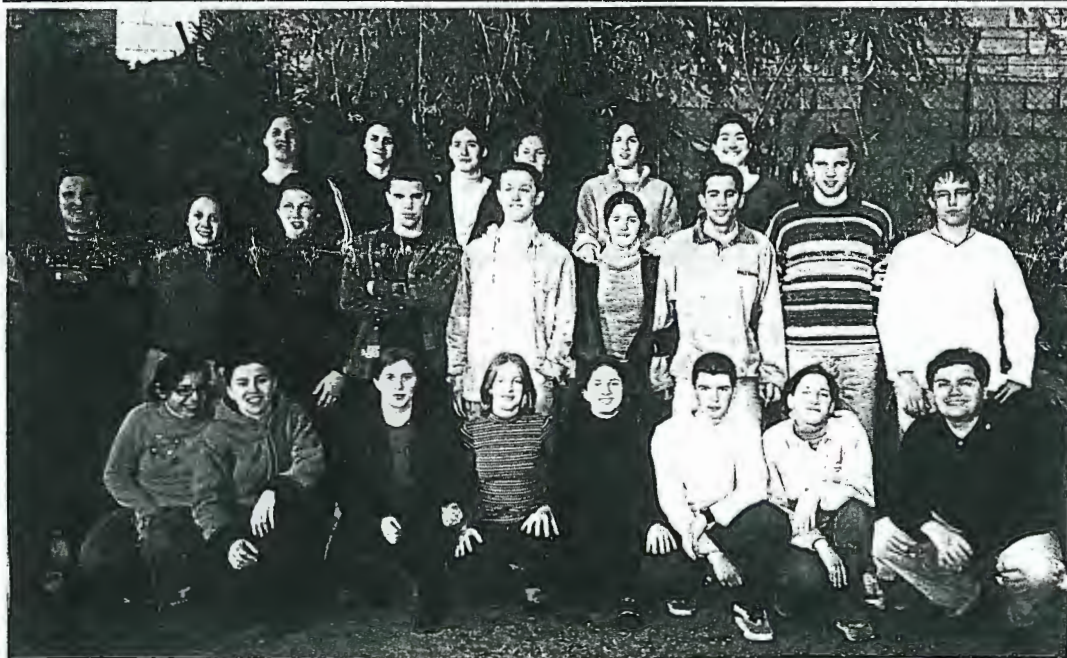
Os alunos da Calheta (Açores) trouxeram mais encanto ao nosso Minho