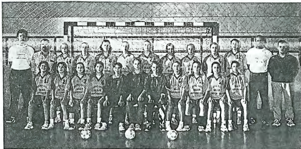
As atletas Juvenis alcançam êxito!