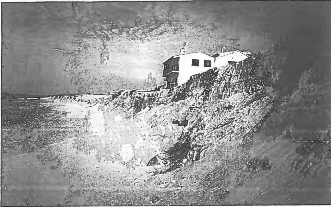
O estado de calamidade da nossa praia! Quem lhe acode?