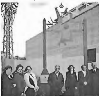
Comitiva de Esposende junto do Monumento ao Dador, em Olías del Rey