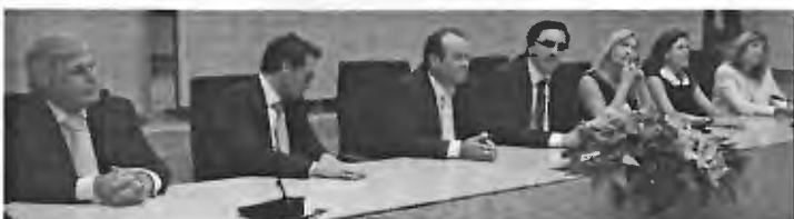
Executivo Municipal de Esposende

No dia 7 de outubro, o Município de Esposende virou mais uma página da sua história no que diz respeito à vida autárquica, com a tomada de posse dos novos eleitos saídos das eleições de 29 de setembro findo.