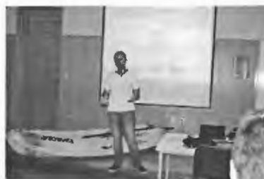
Divulgação da canoagem