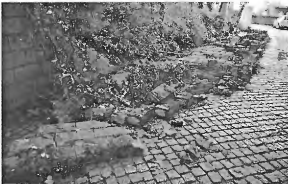
O muro da Quinta do Cristina, do lado poente não aguentou a força da água e cedeu, impedindo a passagem dos veículos

A forte intempérie que ocorreu na noite de 22 de outubro no norte do país afetou a freguesia de S. Bartolomeu do Mar, no concelho de Esposende, de uma forma que causou inúmeros prejuízos a muitos proprietários.