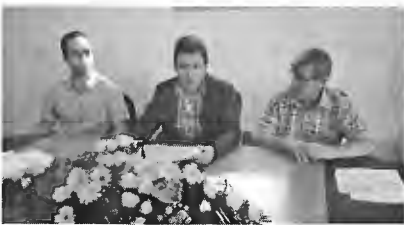
Mesa da Assembleia de Freguesia da União de Freguesias de Belinho e Mar.