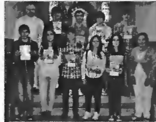
Festa das Bem-aventuranças

Os adolescentes dos sétimo, nono e décimo anos da catequese paroquial realizaram, no passado dia dois, respetivamente, as festas das Bem-aventuranças, do Compromisso e do Envio previstas no guia do catequista.