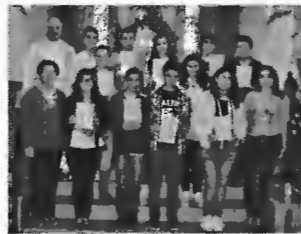
Festa do Compromisso

Foi uma celebração longa, mas nada cansativa e rica de conteúdo, convidativa à participação dos adolescentes em diversas partes da celebração eucarística. E eles corresponderam. Parabéns por isso, porque se prepararam bem e porque, na celebração, estiveram com a atenção necessária para que tudo aparecesse no devido tempo e no devido lugar. Parabéns também às suas catequistas, que prepararam os seus catequizandos ao longo do ano da catequese e, mais concretamente, para estas festas.