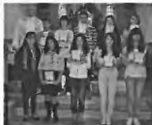
Festa do Envio