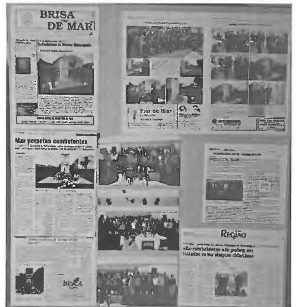
A exposição fotográfica da homenagem aos ex-Combatentes, em 2011, encantou os presentes.