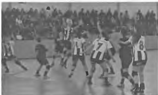
Ataque da Juve Mar nos oitavos da Taça

A meio da parte complementar, a equipa primo divisionária da