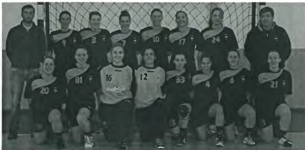
A magnífica equipa da Juve Mar que venceu o Club Sports da Madeira