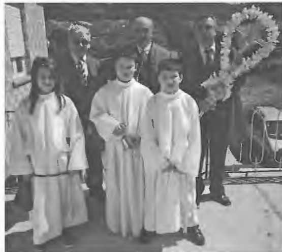
As duas Cruzes que percorreram as habitações da freguesia

Em ambiente de festa e de verdadeira alegria cristã, decorreu a Visita Pascal na Freguesia de S. Bartolomeu do Mar, concelho de Esposende. Com início na Sede da Junta de Freguesia, saíram duas cruces, que percorreram