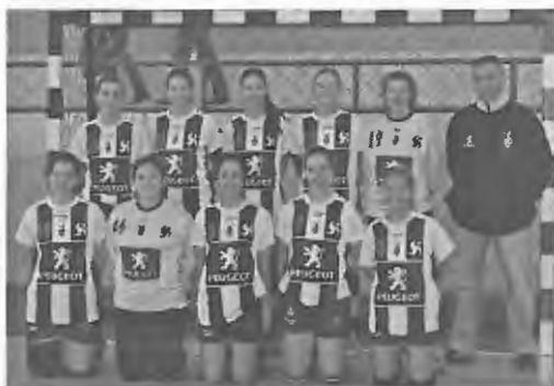
Equipa do Sports da Madeira, Funchal

Decorreu no dia 1 de Maio, no Pavilhão de Mar, quase repleto, um emocionante jogo de andebol a contar para os oitavos de final da Taça de Portugal, entre a Juventude de Mar e o Club Sports da