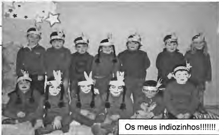
Os meus indiozinhos!!!!!!

Obrigada pais por terem trabalhado juntamente comigo na educação e crescimento dos vossos filhos.