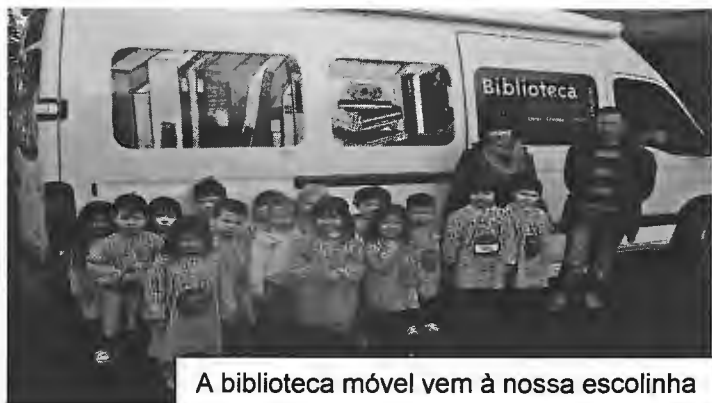
A biblioteca móvel vem à nossa escolinha

Muitas coisas se podiam dizer acerca dos meninos da sala dos 4 anos. Coisas boas, outras menos boas e até outras que deixariam os adultos boquiabertos.