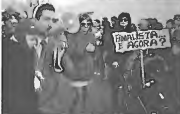
São muitos os foliões da nossa terra que dão uma mão ao melhor Carnaval do concelho.

"Viva a alegria, viva o carnaval e viva a folia" foi o convite deixado pela rainha Vitória I à imensidão de foliões e público que participou na 21ª edição do Carnaval Solidário Carlos Areias, cujo desfile decorreu no dia 19 de fevereiro.