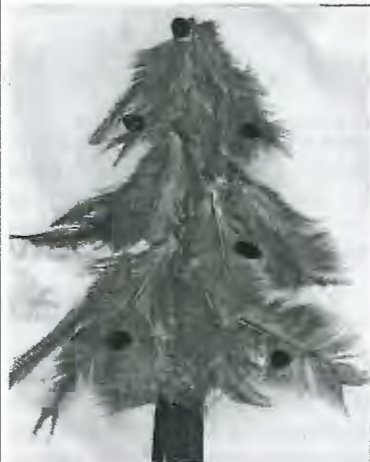
Trabalho realizado com penas pelo ATL do Centro Social de Mar.

Nesta quadra natalícia que se aproxima e face à situação crítica que o país atravessa é tempo do homem abrir o seu coração e pensar no outro que sofre ainda mais que eu. É tempo do