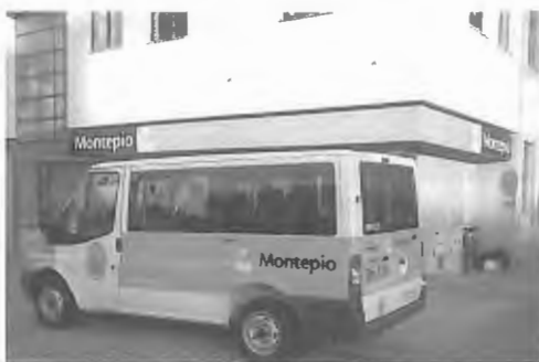
A viatura da "Frota Solidária" junto da agência do Montepio, em Esposende.

A cerimónia da entrega da chave da nova viatura decorreu no Palácio D. Manuel, em Évora.