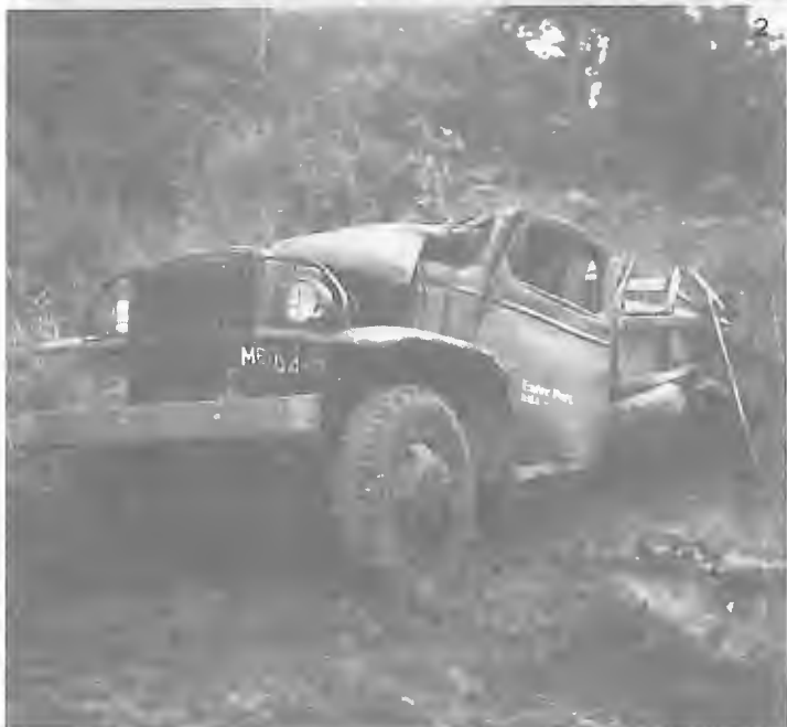
Fotos inéditas: 1: funeral do Gastão Lima; 2: estado da viatura após o ataque à coluna do Gastão Lima.