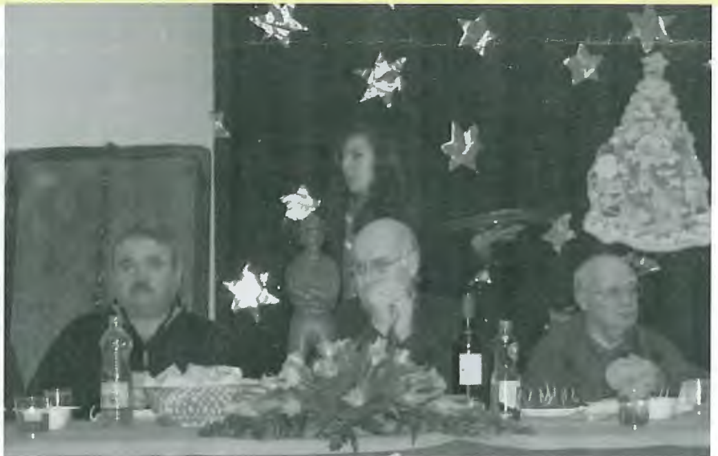
Mesa que presidiu à Ceia de Natal dos Escuteiros de Mar.