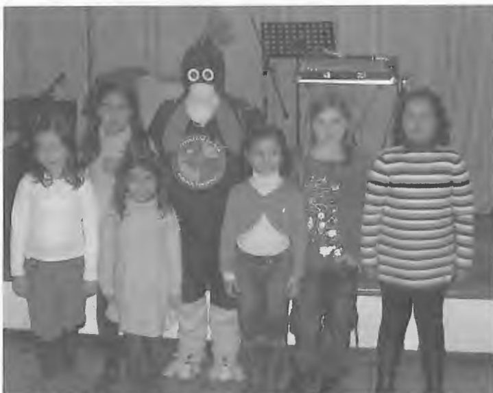
As mais pequeninas deixaram-se fotografar com a mascote da Secção de Andebol