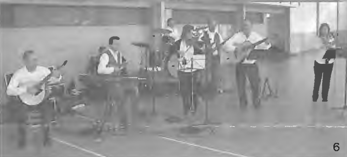
Fotos: 1 - Sala 3 Anos; 2 - Sala 4 Anos; 3 - Sala 5 Anos; 4 e 5- Sala ATL; 6 - Conjunto "COM. TRADIÇÕES"