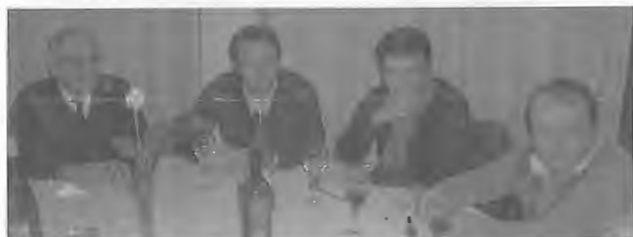
Mesa que presidiu à 1ª Ceia de Natal levada a cabo pela Secção de Andebol do Centro Social da Juventude de Mar de Mar