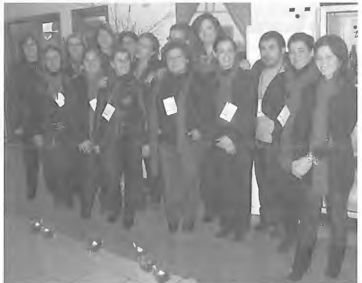
Grupo de Formandos do Curso "Organização de Eventos" da Escola Profissional de Esposende