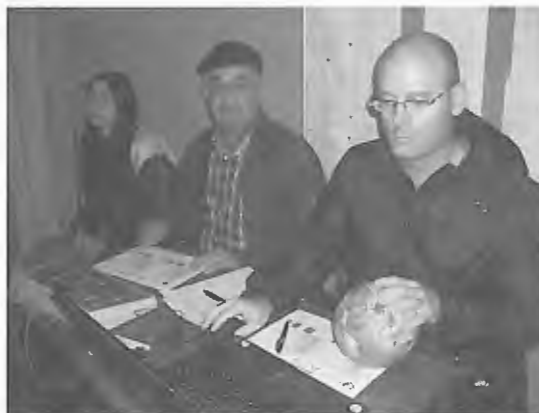
O "Staf" do jogo de Andebol coloca tudo ok para a disputa de mais um jogo, no caso contra o Salgueiros 08

A experiência de Paulo Martins ao longo de onze anos