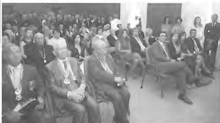
O Salão Nobre dos Paços do Município encheu-se de esposendenses no Dia do Município