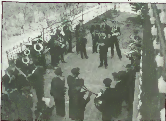
Atuação em Caldelas (Época da Páscoa), em 1941