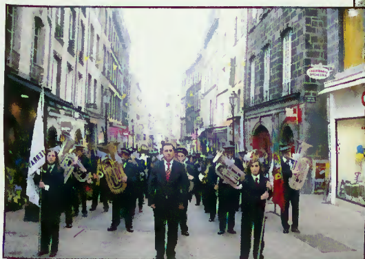
Atuação em Clermont-Ferrand / França, em 2010