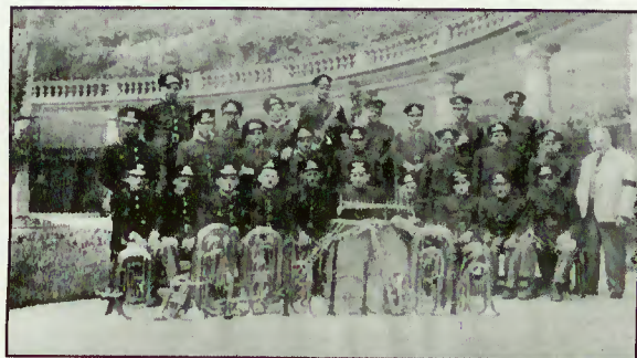
Atuação na Vila do Gerês, em 1950