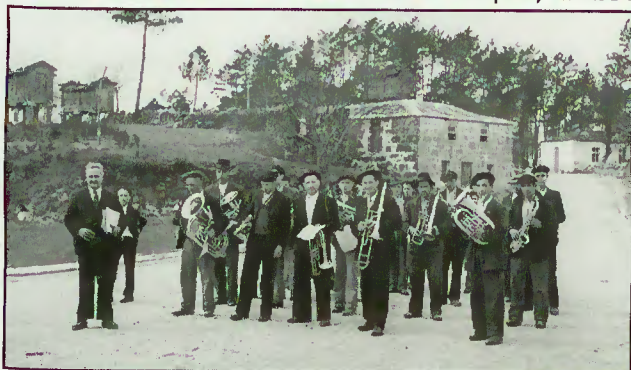
Banda de Carvalheira na atual av. Pe. Martins Capela, em 1954