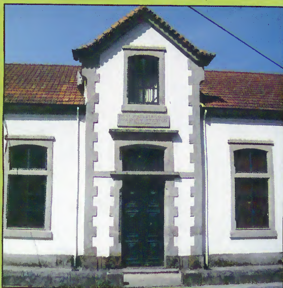
Sede da Junta de Freguesia de Rio Caldo

Já na parte final, foi ainda aprovada, por unanimidade, uma revisão às Grandes Opções do Plano e Orçamento para o corrente ano, fruto da aprovação de uma candidatura aos Fundos Comunitários e respetiva transferência de valores, além de apresentação do relatório semestral do revisor oficial de contas do município.