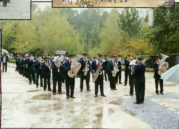
Receção ao Sr. Presidente da República, em 2006