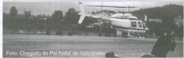
Foto: Chegada do Pai Natal de helicóptero

O Natal dos mais pequeninos ..... >>Página 5