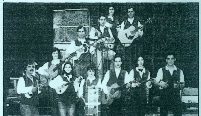
GRUPO DE CAVAQUINHOS DA CASA DO POVO DE TADIM