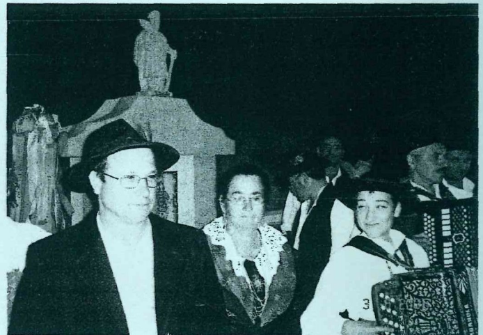
Rancho Folclórico da Casa do Povo de Martim