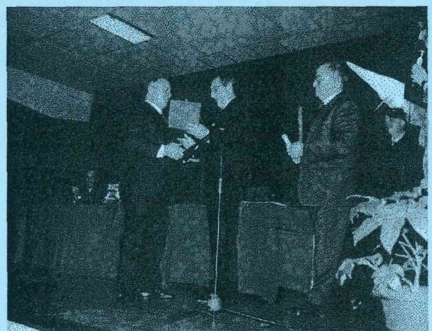
Primeiro Presidente de Direcção recebe lembrança e certificado