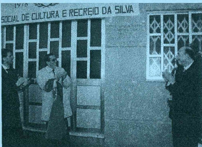
Senhor Governador Civil e Vice-Presidente da Câmara no descerramento de placa comemorativa