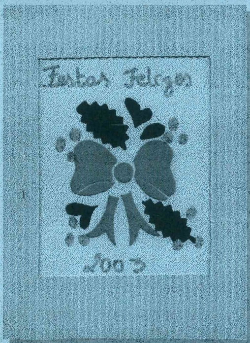
Trabalho executado no ATL

O Centro Social de Cultura e Recreio da Silva apresenta a todos os leitores