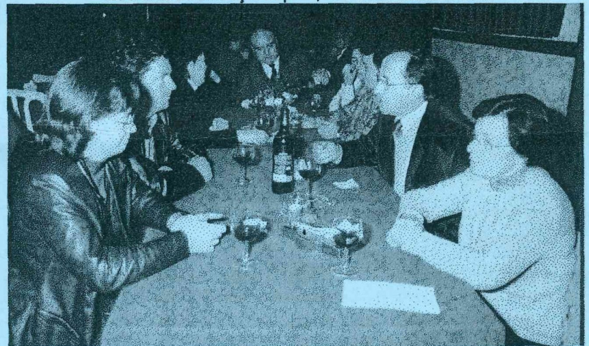
A assistência num dos intervalos com a mesa de aperitivos e bebidas