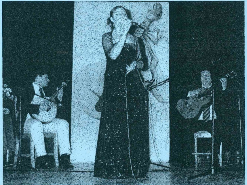
Os artistas e a decoração no palco, mostra bem a noite diferente

Durou, até altas horas da madrugada com grande maioria das pessoas a pedirem mais eventos destes, no futuro.