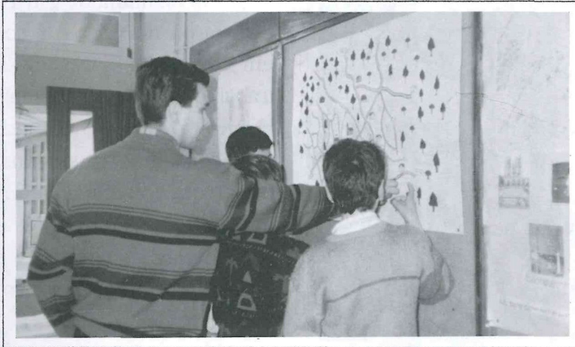
Presidente da Junta de Paradelá ajuda alunos na localização das lixeiras

Na semana da "Imprensa ao serviço da Ecologia", que decorreu de 7 a 11 de Março, vieram às E.B.M.s de Paradelá e Faria, os Presidentes das Juntas de Freguesia, para ajudar os alunos a localizarem as lixeiras, nas plantas das freguesias e também para dar a sua opinião sobre este problema.