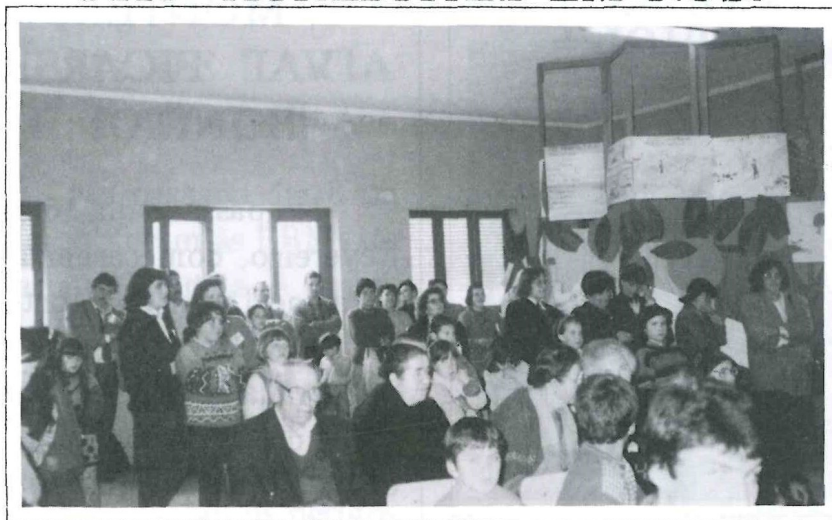
Presidentes da Junta (ao fundo), ACRAP e Delegação de Saúde (à direita)