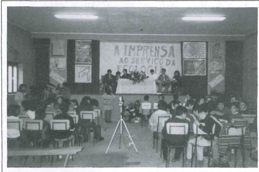
Tudo a postos para a Conferência de Imprensa

Na passada sexta feira, dia 11 de Março realizamos uma Conferência de Imprensa no Salão Paroquial de Faria.