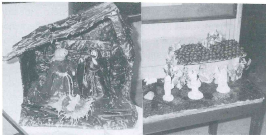
O 1º e o 3º lugares

No passado dia 5 de Fevereiro, pelas 10 h e 30 m, na sede da ACRAP, em Barcelos, decorreu a entrega dos prémios às escolas vencedoras do concurso "O Presépio visto pelas Crianças".