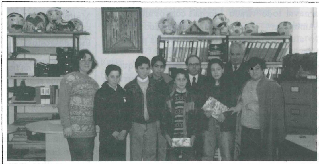
Os alunos com a Direcção da ACRAP e Vereador da Cultura de Barcelos

As EBMs de FARIA e PARADELA ganham o 1º e 3º PRÉMIOS num concurso de presépios