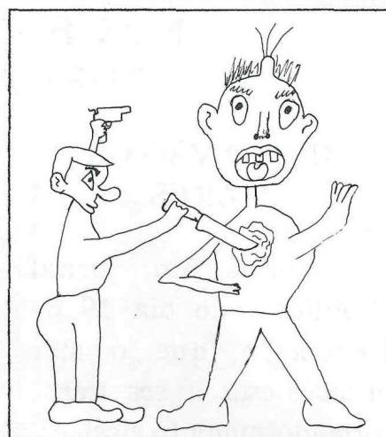
Desenho de José Manuel 6 o Paradela