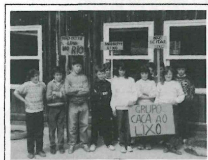
Assim começou os "Caça Lixo"

Mais detalhes no próximo jornal e também a notícia, quem sabe, que os outros dois Presidentes de Junta também estarão conosco na grande "CAÇA AO LIXO"!