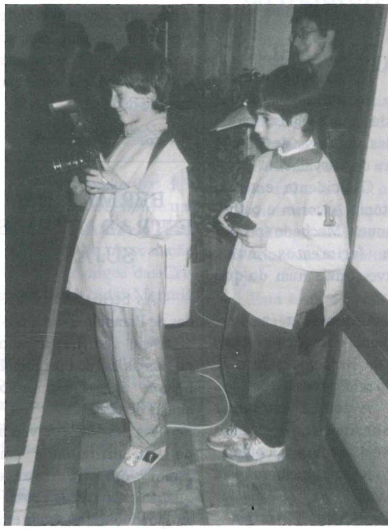
Os nossos repórteres fotográficos