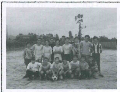
Equipa de Vila Seca

O jogo estava previsto ser entre Faria e Gilmonde, mas como este não pode comparecer, Vila Seca concordou em jogar e Faria acabou por perder por 5 bolas a 3.