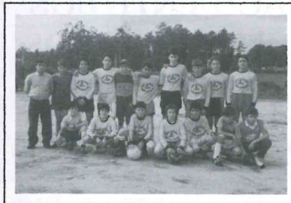
Equipa de Faria

Domingo, dia 10 de Outubro, no Campo da Farrapa, em Gilmonde, realizou-se um jogo de futebol entre os jovens de Faria e Vila Seca, com idades até aos 14 anos.