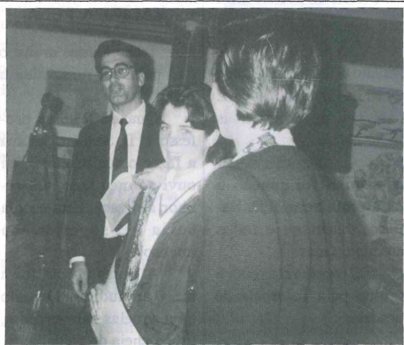
Entrega de Diploma pelo Sr. Secretário de Estado da Educação

Foi uma experiência inesquecível para os alunos das EBM de Faria e Paradela.