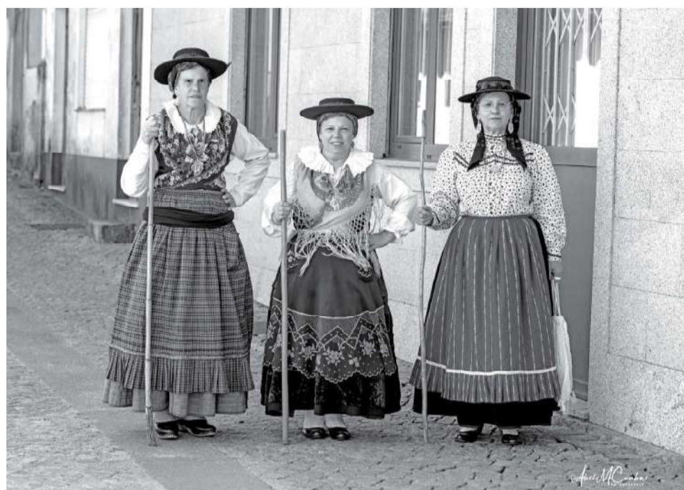
Traje de contratadeira de feira

Entre as "mulheres de armas" surgiam as contratadeiras, que ocupavam o espaço da negociação de alto risco. Constantemente com uma vara na mão, tal como os homens, usavam-na para apartar os animais ou para enfatizar um argumento durante uma discussão de preço. Diferentes da camponesa comum, eram profissionais que compravam colheitas e gado antecipadamente para revenda, demonstrando uma agilidade mental para o cálculo que lhes permitia negociar de igual para igual com os homens. Com elas não havia espaço para conversas fiadas: o assunto era dinheiro e arrobas. O seu traje era o rótulo