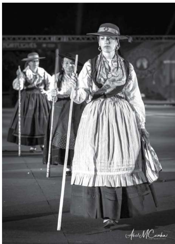
Traje de contratadeira de feira

da sua austeridade: usavam o chapéu de feltro preto ou castanho por cima do lenço (de algodão ou chinês, com padrões orientais que chegavam pelos portos), o que lhes conferia uma silhueta imponente e respeitada.