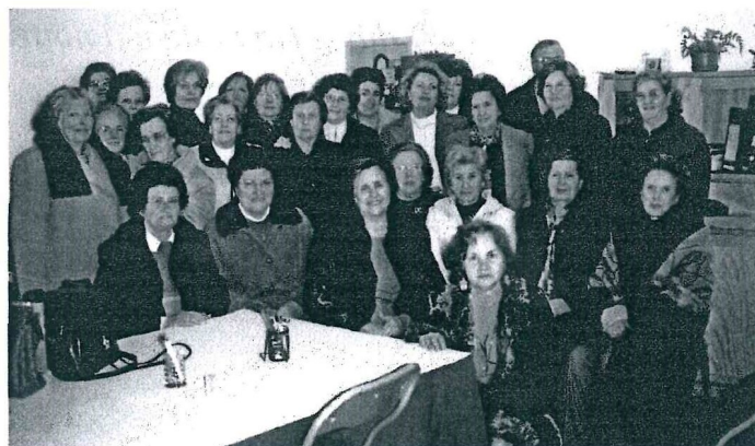
2004 – 8º aniversário