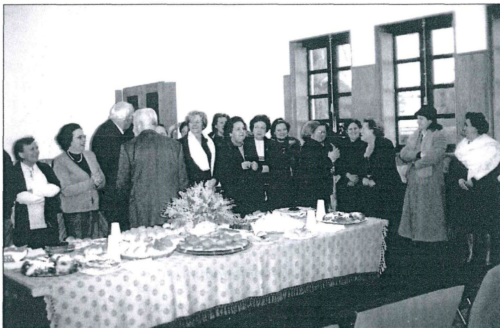
O IAESM foi muito bem recebido pela U.A.E.

No dia 11/11/2003 o Instituto, a convite da U.A.E. deslocou-se a Esposende ao magusto daquela Universidade. Foram muito bem recebidas as sócias do IAESM e em agradecimento, convidaram a U.A.E. para um lanche. Este foi servido na Fervença,