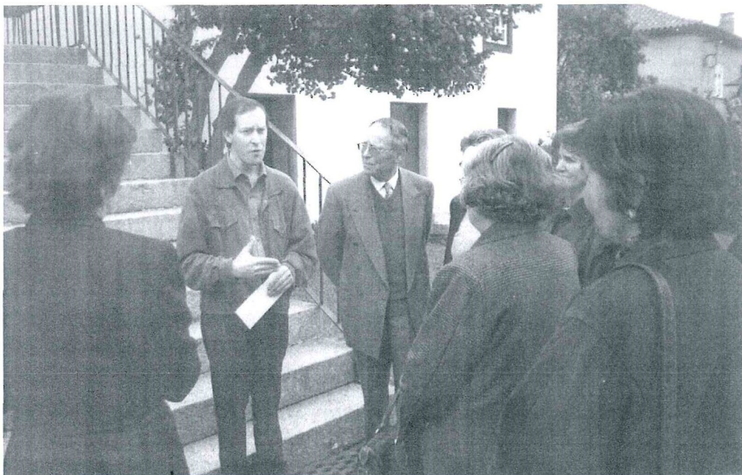
Visita à Casa/Museu de Camilo – S. Miguel de Seide

Em Fevereiro fez-se uma visita de estudo à Casa/Museu de Camilo, em S. Miguel de Seide – Vila Nova de Famalicão.