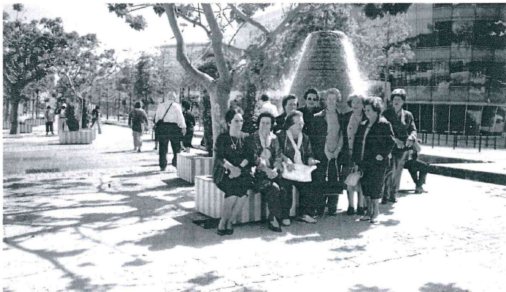
Passéio Anual – Parque das Nações