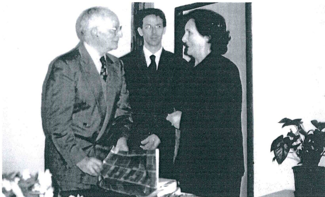
Inauguração da Sede do I.A.E.S.M em 11/11/2002