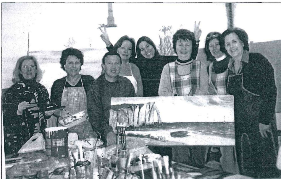
Workshop em Arteterapia – Grupo da Manhã