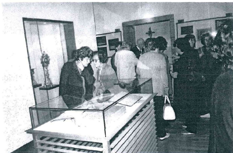
Visita ao Museu do Ouro – Travassos – Póvoa do Lanhoso

Chegados aí fomos visitar o Museu do Ouro, onde nos esperava o seu proprietário que nos contou a história do mesmo e nos guiou numa visita pelo museu. Alguns sócios fizeram compras.