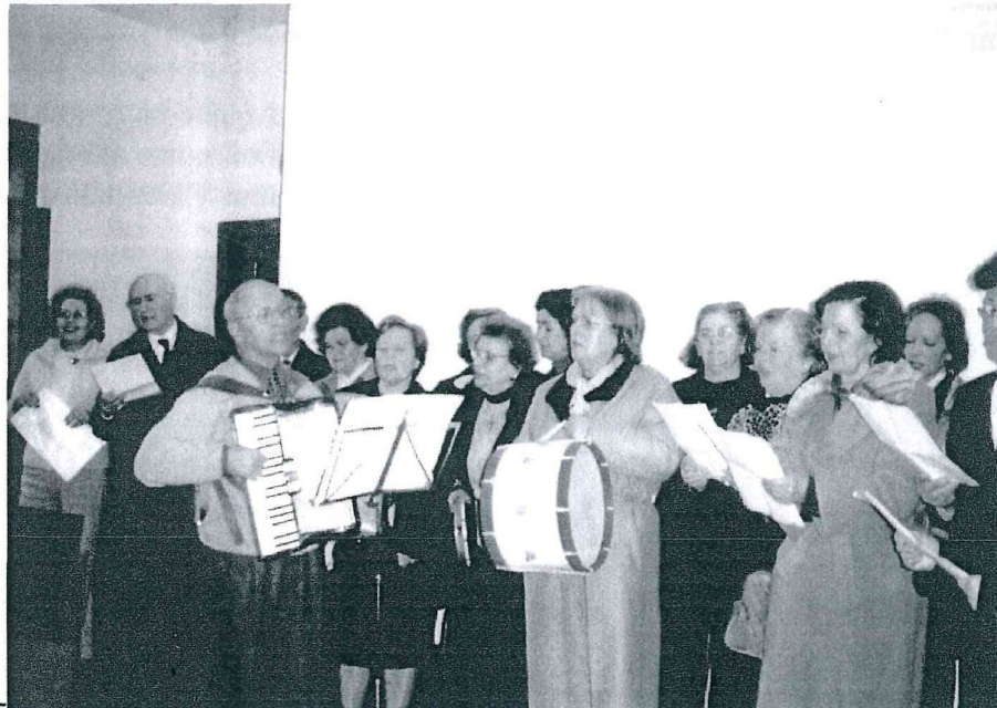
O IAESM foi cantar os Reis à U. A. E.