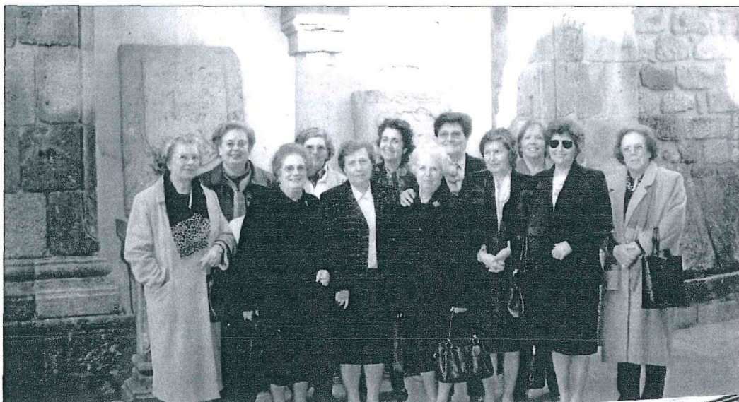
Visita ao Museu da Sé

Neste ano houve recolha de roupas, calçado e toalhas, para o GASC que foram entregues por altura do Natal.