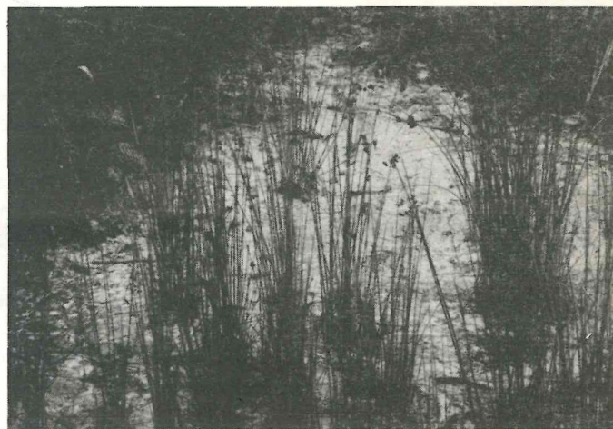
Os esgotos da Cerâmica degradam o pinhal e desaguam no rio

Uma recente vistoria da Câmara de Viana detectou uma série de irregularidades e levantou os respectivos autos. A Autoridade Sanitária verificou o estado de insalubridade existente e uma inspectora do ambiente da D.G.Q.A. e técnicos da Secção Hidráulica de Viana procederam a uma vistoria. Aguardam-se resultados.