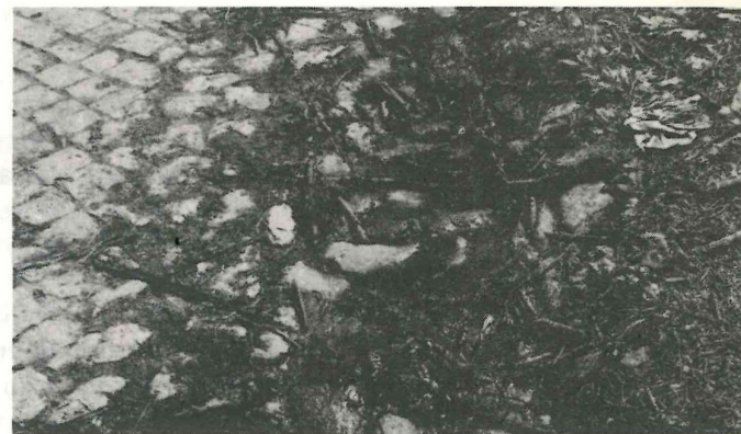
Os esgotos da Lavandaria despejados em plena via pública...