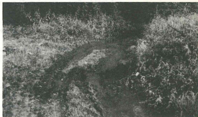
Os efluentes inundam um caminho e são canalizados para o Neiva

A Rio Neiva — Associação de Defesa do Ambiente é uma associação de carácter regional que tem como principal objectivo defender e valorizar o ambiente e o património cultural da região. A sua área de intervenção abrange o vale do rio Neiva e o litoral do concelho de Esposende.