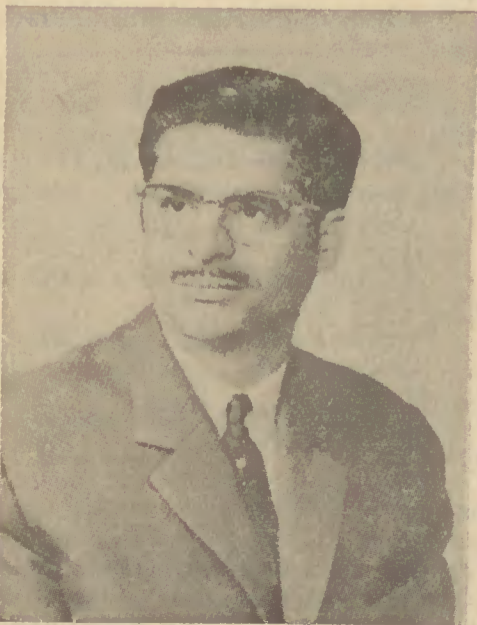
esta data se comemore por muitos anos junto de sua idolatrada esposa e filhinhos e restante família ali residente.