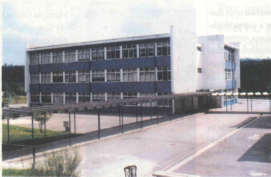
Escola Secundária de Barcelos – corpo de aulas (Bloco A)

Dado que, apesar disso e continuando como Secção Mista do Liceu Sá de Miranda, havia ne-