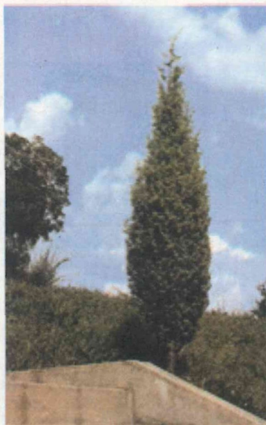
Cedro de Espanha (Arboreto da flora autóctone de Portugal Continental)