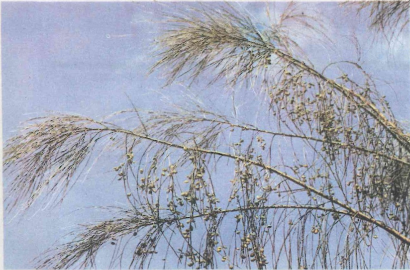
Piorno branco (Arboreto da flora autóctone de Portugal Continental)