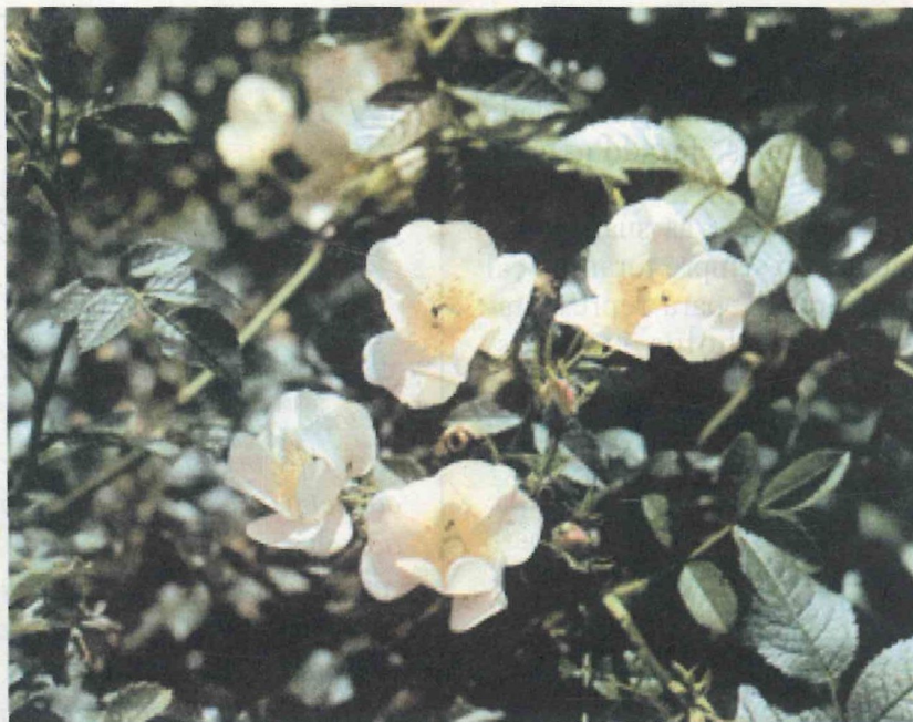
Roseira brava (Arboreto da flora autóctone de Portugal Continental)

Pode parecê-lo ... mas não é! Nem publicidade de supermercado, tão pouco promessa demagógica de candidato em período eleitoral! Trata-se de de-