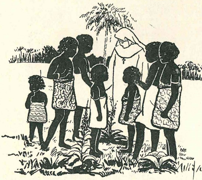
As crianças vinham à escola

Tahiswa, que falava um dialecto parecido com a língua zulu.