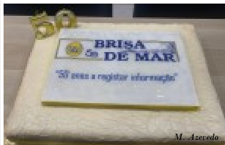
O saboroso bolo de aniversário da Panizende.

Estas comemorações tiveram o apoio da Câmara Municipal, Junta de Freguesia e Paróquia de S. Bartolomeu do Mar, que cedeu as instalações.