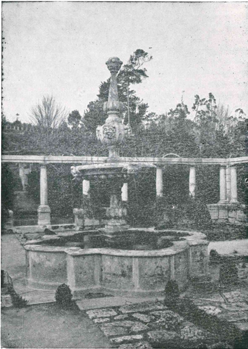
Restos do claustro do extinto convento de Nossa Senhora da Conceição, em Leça da Palmeira, onde viveu os últimos anos da sua existência e ficou sepultado D. Francisco de Sá de Meneses, Conde de Matosinhos.