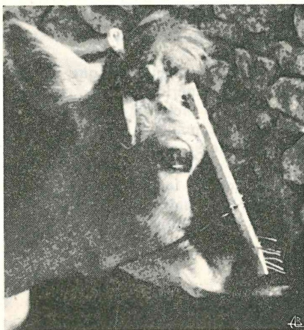
Fig. 2 — Botilho ou focinheira, visto de perfil

Porém na nota 13, pág. 175, lê-se: «Mesmo que a designação tabuleta exista em Itália, o facto de a palavra ser portuguesa, indica certamente uma origem portuguesa do barbilho».