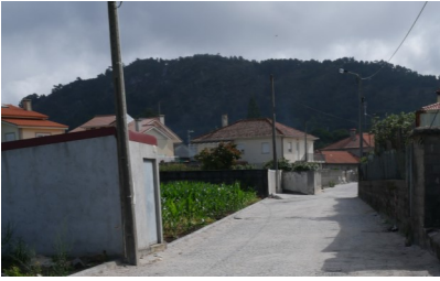
A de Fora: ao fundo o estrangulamento da rua.

presidente da junta; 4 - Período da Ordem do Dia: 4.1 – Ata da sessão ordinária de 25 de abril de 2024 – proposta de aprovação; 5 – Período de Intervenção do público.