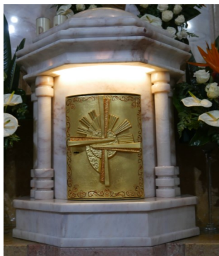
Sacrário da Igreja Paroquial de S. Bartolomeu do Mar, Esposende

Realizando-se nos finais deste mês e no princípio de junho, em Braga, o V Congresso Eucarístico Nacional e desconhecendo quase toda a gente de Mar