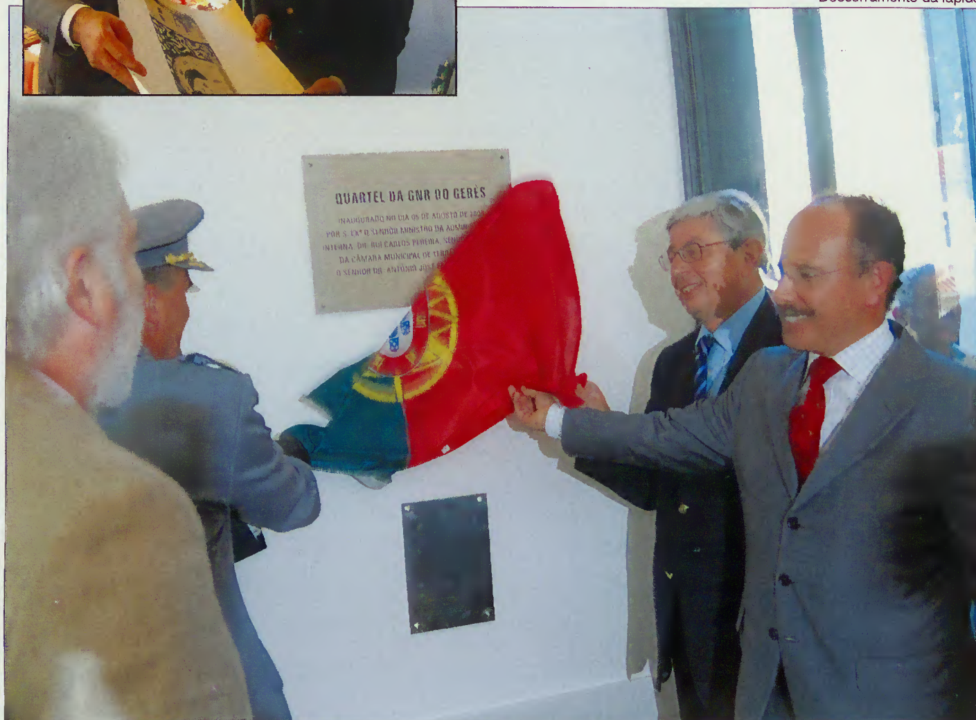
Descerramento da lápide