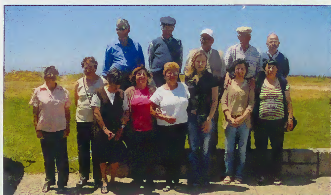
Participantes na Colónia

No período compreendido entre os dias 23 e 30 de