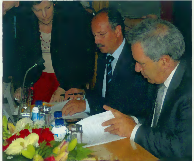
Momento da assinatura do protocolo

O contrato de financiamento foi protocolado em cerimónia realizada em Paredes de Coura, no dia 06 de Agosto corrente, tendo o edil terrabourense manifestado o seu agrado pela valorização atribuída ao projecto do Natur Parque, considerando que a concretização do projecto aumentará e diversificará a oferta de actividades no âmbito do turismo ambiental e científico a partir do potencial da antiga aldeia de Vilarinho, tendo, inclusive, como parceiro a Associação dos Antigos Moradores - AFURNA.