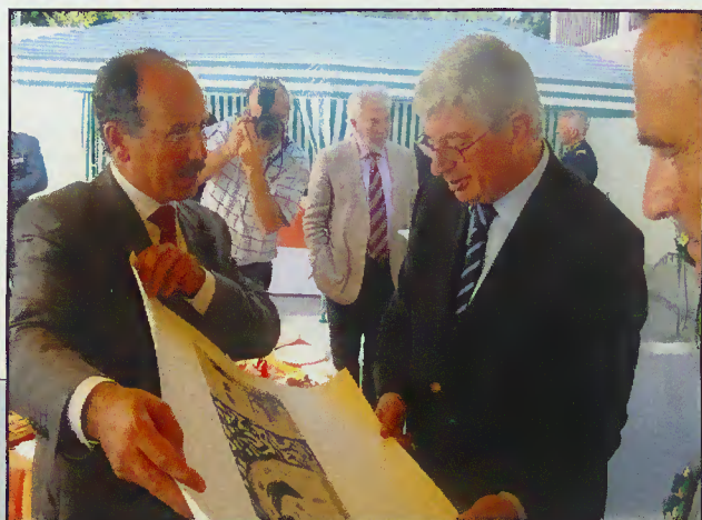
Presidente oferece serigrafia ao Senhor Ministro

Deste modo, deu-se um passo significativo na recuperação do património urbanístico da vila termal, aproveitando para o colocar ao serviço público.