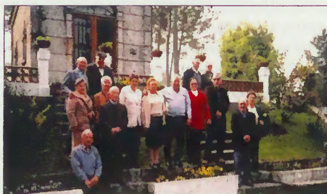
Participantes no intercâmbio

Entre os dias 16 e 25 de Junho, decorreu, na Apúlia, a Colónia de Férias Sénior, na qual participaram 14 idosos de Terras de Bouro.