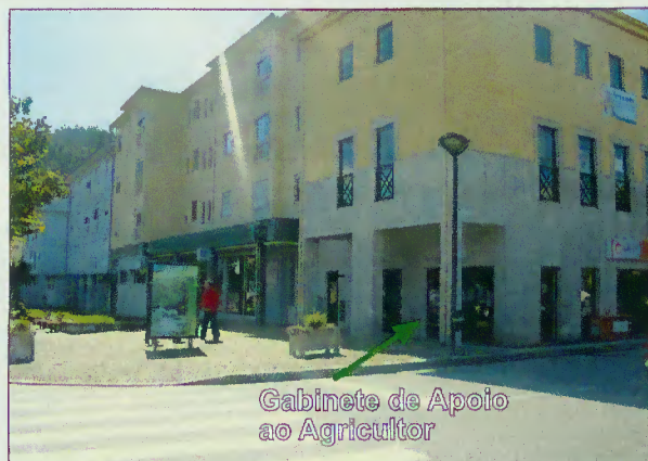
Gabinete de Apoio ao Agricultor

O Gabinete de Apoio ao Agricultor é uma nova valência do Município de Terras de Bouro, a funcionar no antigo posto de Turismo da Câmara Municipal, tem como objectivo a dinamização da agricultura, o apoio gratuito no processo de candidaturas às ajudas comunitárias, bem como serviços de recolha de amostras para análise de solos, plantas e águas de rega. O GAA conta com um posto de atendimento SNIRA (Sistema Nacional de Informação e Registo Animal). A dinamização desta nova valência é da responsabilidade de duas técnicas superiores da área agrícola, sendo o horário de atendimento de Segunda a Quinta-feira das 8.30h às 17.00h e na Sexta-feira das 8.30h às 13.00h.