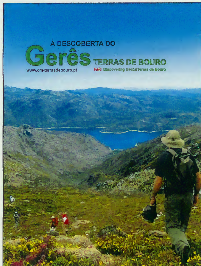
Capa da revista

ao turismo de praia e de grandes massas que traz ao Gerês cada vez mais amantes da natureza.