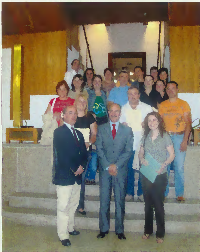
Formandos presentes na Cerimónia de entrega de diplomas

Dada a importância de que se reveste a formação contínua, em regime pós-laboral, o município tem previsto para o Outono, acções modelares em informática no vale do Cávado e Homem, sendo oportunamente divulgadas as inscrições.