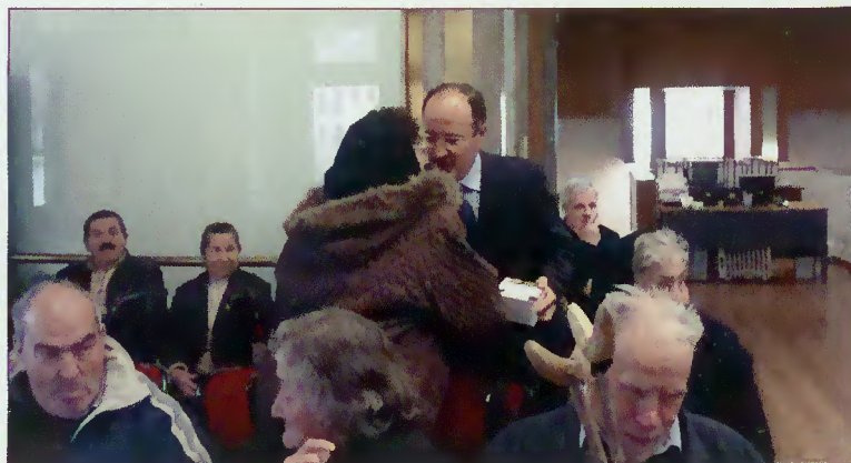
Presidente da Câmara entrega telemóvel

Todos os idosos que estejam contemplados pela medida do CSI (a receber o Complemento Solidário para Idosos) podem contactar os serviços da Câmara Municipal para se candidatarem à oferta do respectivo telemóvel.