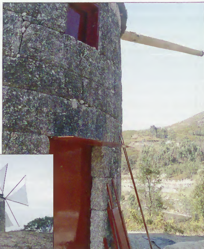
Moinho de vento de Gilbarbedo