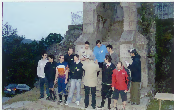
Presidente da Junta entrega prémios

Com esta iniciativa, a autarquia aproveitou mais uma oportunidade para trazer visitantes e dar a conhecer a freguesia de Carvalheira.