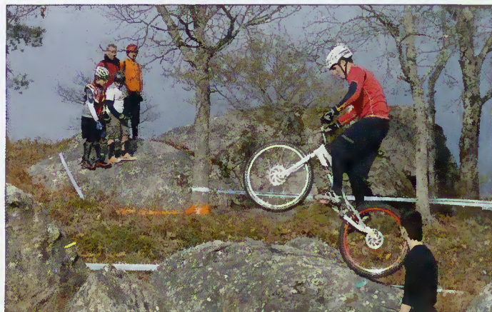
Momento da prova

Depois da experiência do ano anterior, a freguesia de Carvalheira voltou a receber, no Monte de Bom Jesus das Mós, a prova de Trial a contar para o Campeonato Nacional.