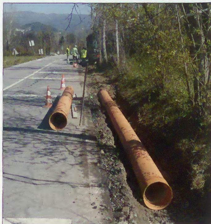
Execução das obras