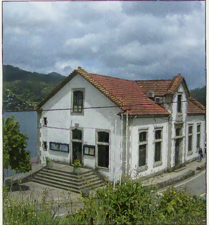
Extensão do Centro de Saúde em Rio Caldo

Os autarcas manifestaram também ao responsável regional do sector da saúde o desagrado pelo cancelamento das obras de remodelação do Centro de Saúde de Terras de Bouro que estiveram previstas já para o fim do ano anterior.