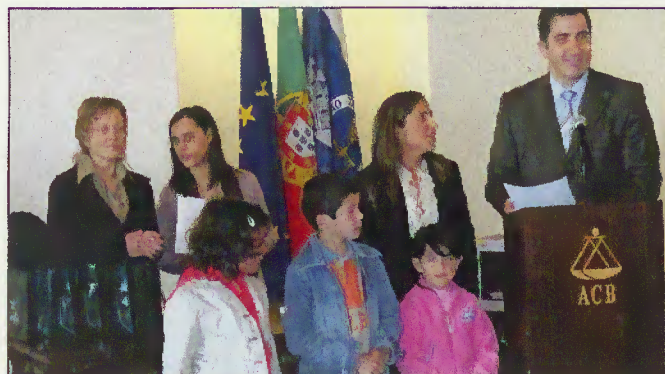
Entrega de prémios

Para os alunos das escolas vencedoras o evento foi um dia especial pela deslocação a Braga, à sede da Associação Comercial, para receberem o prémio do concurso, tendo a autarquia colaborado na sua realização.