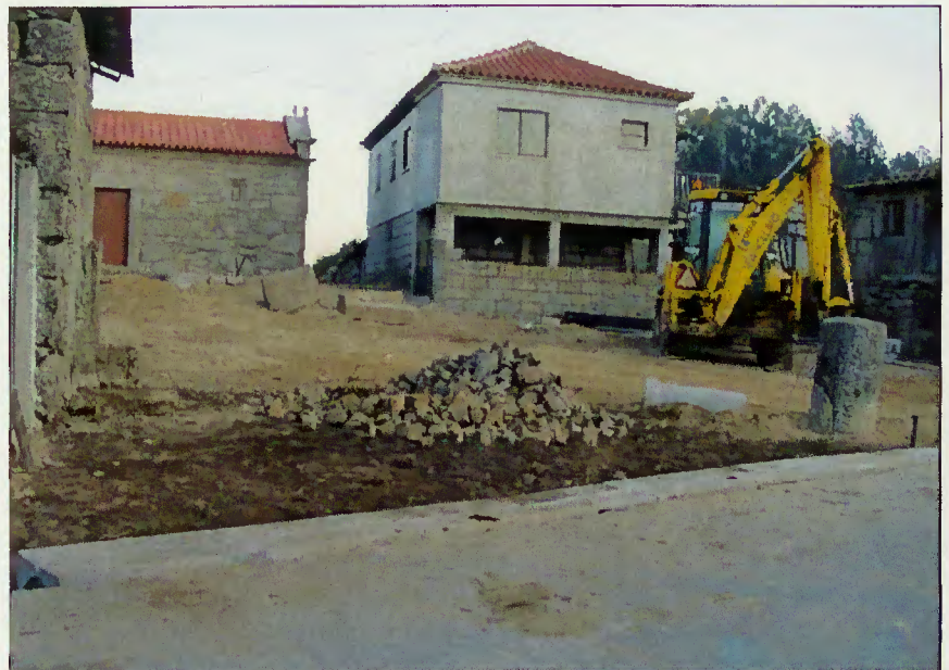
Obras em execução

Para Terras de Bouro o lugar de Santa Cruz assume significado especial na medida em que constitui uma pequena portela de entrada daquela via no vale do Homem, deixando para trás o vale do Cávado (Amares), para depois percorrer, durante cerca de trinta quilómetros, o concelho de Terras de Bouro até à Galiza, constituindo um legado cultural e ambiental de elevado valor.