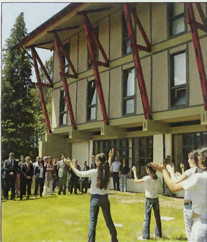
Alunos da Escola P. Martins Capela apresentaram danças aos convidados