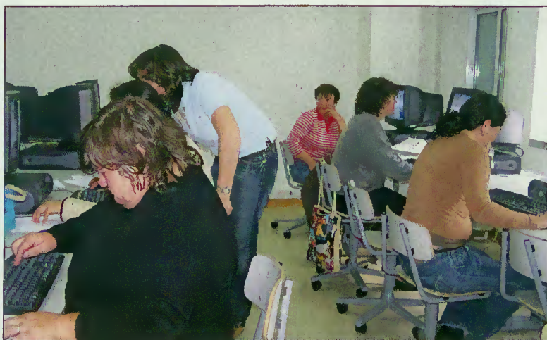
Alunos em formação

Neste momento, estão no terreno acções de aquisição, validação e certificação de competências pelo Pólo de Terras de Bouro daquela Escola e pela ATAHCA que, na sede do concelho, em Rio Caldo e no Gerês, estão a terminar alguns cursos.