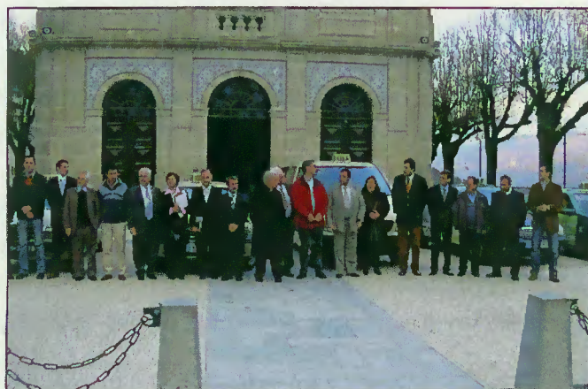
Participantes e organizadores do curso

A Câmara Municipal de Terras de Bouro apoiou a iniciativa da TUREL por considerá-la pioneira e vantajosa como estratégia para a valorização e motivação sócio-profissional, reconhecendo a relevância da acção concebida e executada pela TUREL e patrocinada pela Irmandade de S. Bento da Porta Aberta.