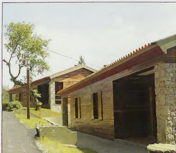
Aspecto parcial das instalações