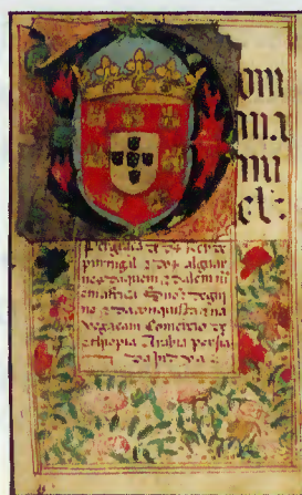
Capa do Foral

Apesar de Terras de Bouro, ao longo da sua história, registar muitos acontecimentos cujas datas mereceriam ser destacadas, a opção pela data de 20 de Outubro justifica-se