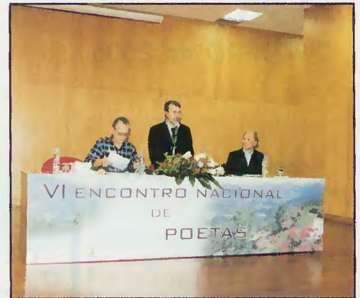
Cerimónia de abertura

A vila do Gerês recebeu, no dia 30 de Setembro, o VI Encontro Nacional de Poetas organizado pela Câmara Municipal de Terras de Bouro, pela CALIDUM e pelo jornal Poetas & Trovadores , tendo trazido ao Gerês cerca de uma centena de poetas de todo o país.